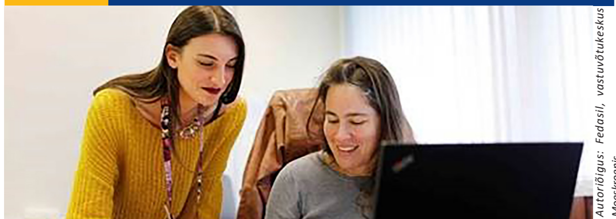
Autoriietus: Fedasil, vastuvõtukeskus Moeskroenis