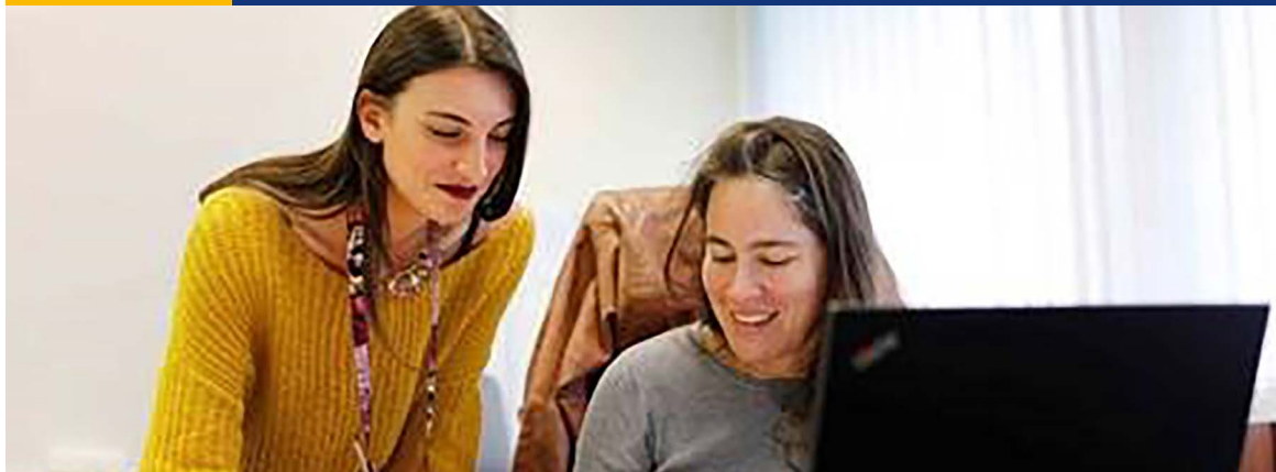
εγκατάσταση υποδοχής στο Moeskroen