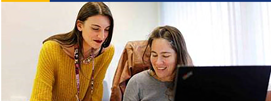
Авторско право на Федералната агенция за приемането, налице, курсещи убежище, приемен център в Мусфрон